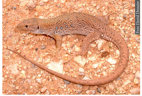
Figura 2. Timon tangitanus de Ifrane, Marruecos.

Durante la crisis del Tortoniense (14 Ma; Krijgsman, 2002) o la posterior crisis del Mesiniense, es probable que pasaran a la orilla norte del Estrecho de Gibraltar formas norteafricanas encontradas como fósiles en la Península Ibérica, como un ánguido ( Ophisaurus ), un agámido ( Laudakia ), una serpiente gato ( Telescopus ), una boa jabalina ( Eryx ) y cobras ( Naja ) (Szyndlar & Schleich, 1994; Szyndlar & Rage, 1990; Szyndlar, 2000; Gleed-Owen 2001; Blain 2005). Entre las especies que aún perduran en la fauna actual, se ha sugerido que durante la crisis del Mesiniense pasaron Acanthodactylus erythrurus (Harris et al. , 2004a), Tarentola mauritanica (Harris et al. , 2004b), Natrix maura (Guicking et al. , 2006) y Chalcides bedriagae (Carranza et al. , 2008). En sentido contrario (norte-sur), durante el Tortoniense se ha sugerido que pasó Timon (Figura 2; Paulo et al. , 2008) y unos 3-4 millones de años más tarde, durante el Mesiniense, se ha sugerido que pasaron Podarcis (Harris et al. , 2002; Pinho et al. , 2006), Blanus (Vasconcelos et al. , 2006; Albert et al. , 2007) y diversas especies de anfibios como Discoglossus (Zangari et al. , 2006); Alytes (Fromhage et al. , 2004; Solano et al. , 2004); Pelobates (Figura 3; García-París et al. , 2003); Salamandra (Escoriza et al. , 2006), Pleurodeles (Carranza & Arnold, 2004), Pelophylax (Beerli et al. , 1996) y, aunque aún no se ha publicado, existe la posibilidad de que