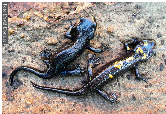
Figura 6. Salamandra algira tingitana de Tagramt, Marruecos.

La composición de la fauna en la orilla sur del estrecho es el resultado de una historia más complicada de la que dibuja la simple dispersión hacia el noroeste de África de formas etiópicas, o la formación del Estrecho de Gibraltar. Algunos de los factores que se supone han intervenido en la conformación de esa fauna, se citan a continuación: