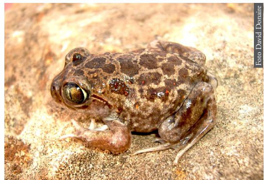
Figura 3. Pelobates varaldii de Kenitra, Marruecos.

En relación a la formación del Estrecho de Gibraltar como proceso vicariante, hay algunas especies que han mostrado un dimorfismo morfológico y, sobre todo, una distancia genética, que está en concordancia con el tiempo transcurrido, aproximadamente 5.33 Ma. En anfibios seis de los siete grupos hasta ahora estudiados siguen este patrón vicariante ( Salamandra , Pleurodeles , Alytes , Discoglossus , Pelobates y Pelophylax ); mientras que en reptiles la apertura del Estrecho de Gibraltar parece haber afectado tan solo a seis de los 15 grupos estudiados hasta el momento ( Acanthodactylus , Blanus , Natrix maura , Chalcides , Tarentola y Vipera ). Si el proceso de vicarianza ocurrió para