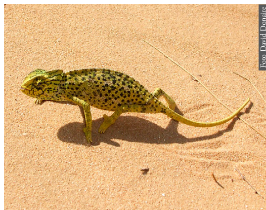
Figura 5. Chamaeleo chamaeleon de Barbate, Cadiz, España.

compañía, o por su carácter de especies comensales. Su presencia en ambas orillas del estrecho probablemente se deba a introducción activa o pasiva por parte del hombre, y date de épocas históricas o a lo sumo prehistóricas. En islas del Mediterráneo Occidental este es el origen conocido para numerosas especies de vertebrados (Vigne & Alcover, 1985; Mayol, 1997). Sería el caso de Testudo graeca (Alvarez et al. , 2000), Chamaeleo chamaeleon (Hofman et al. , 1991; Paulo et al. , 2002), algunos linajes de Tarentola mauritanica (Harris et al. , 2004a, c) y Hemidactylus turcicus (Carranza & Arnold, 2006). Testudo graeca ha sido mantenida en semi-