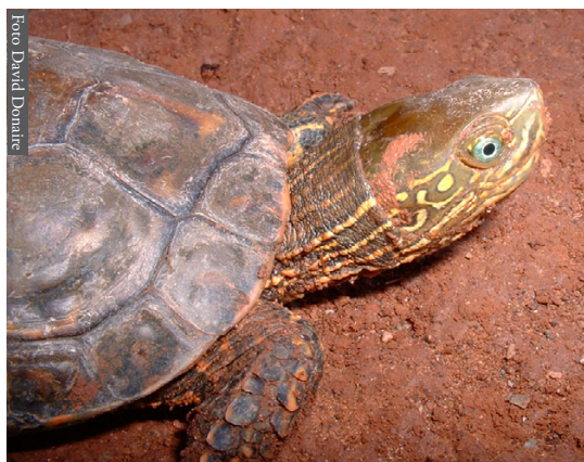
Figura 4. Mauremys leprosa saharica de Ued Masa, Marruecos.

cautividad por diversas culturas Mediterráneas (Fahd & Pleguezuelos, 1996), por lo que no es de extrañar su introducción de forma voluntaria por parte del hombre, como sigue ocurriendo actualmente a través del Estrecho de Gibraltar (Mateo et al. , 2003). Chamaeleo chamaeleon (Figura 5) ha tenido un sentido mágico para el hombre a lo largo de la historia (Blasco et al. , 2001), que continuamente lo ha desplazado a lo ancho del Mediterráneo; incluso, los marcadores moleculares han permitido detectar que las poblaciones ibéricas han tenido un origen doble en época reciente (Paulo et al. , 2002). Los hábitos rupícolas de las salamanguetas presentes en el área de estudio favorece el que frecuenten las habitaciones humanas, y es bien conocido la amplia disper-