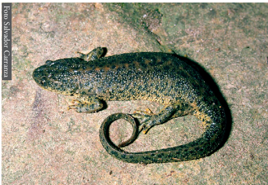
Figura 7. Pleurodeles nebulosus de Ain Draham, Túnez.

e) Por último, en un contexto temporal más próximo, Le Houerou (1992) ha reconstruido el progreso de los límites del desierto del Sahara desde hace 18 000 años, estudiando la vegetación y las dunas fósiles; ha concluido que el límite septentrional del desierto se ha movido hacia el norte durante este periodo, alcanzando la costa del Mediterráneo en el Marruecos Oriental. Ello explica el importante contingente de reptiles saharianos que alcanzan el Mediterráneo en el Rif Oriental ( Uromastix acanthinurus , Acanthodactylus boskianus , A. maculatus , Stenodactylus sthenodactylus , Spalerosophis dolichospilus ; Fahd & Pleguezuelos, 2001), algunos de ellos aproximándose o alcanzando el Estrecho de Gibraltar a través de las áridas costas del Mediterráneo, como Psammophis schockari (Mateo et al. , 2003). En cualquier caso, la distribución de los reptiles a lo largo de la franja del Rif da lugar a un proceso de reemplazamiento de fauna Mediterránea y Paleártica de Oeste a Este, por fauna sahariana de Este a Oeste (Figura 1 en Fahd & Pleguezuelos, 2001). Sin embargo, las especies afectadas por este reemplazamiento apenas se agrupan en corotipos, probablemente como consecuencia que el proceso de colonización de fauna sahariana hacia la costa del Mediterráneo a través del valle del Ued Muluya está aún en un proceso actual y dinámico (Real et al. , 1997).